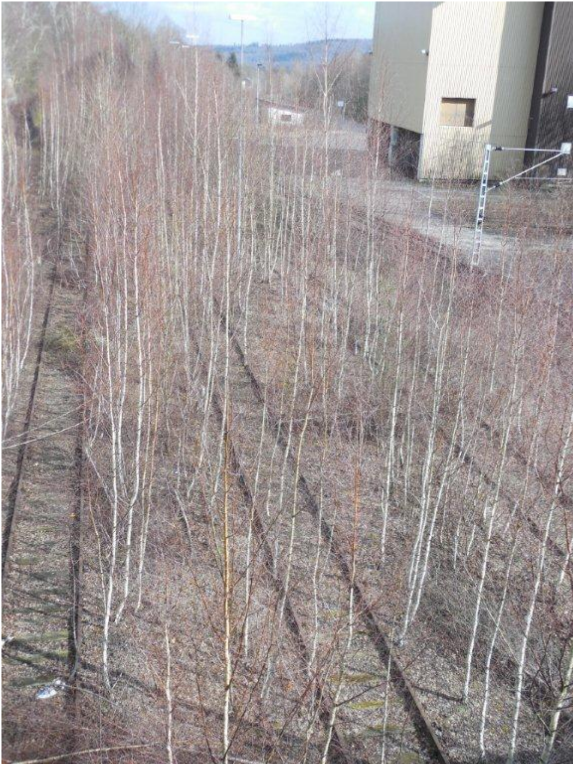
Die Natur erobert sich ihren Lebensraum zurück an der Grube Göttelborn.