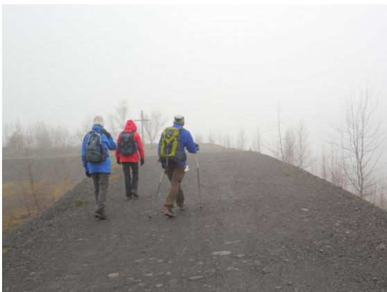
Halde Lydia bei Fischbach