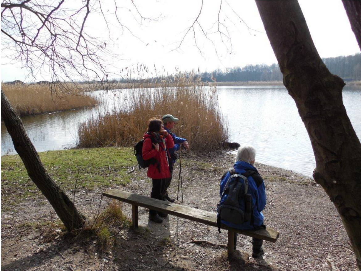
Absinkweiher der Grube Götzelborn